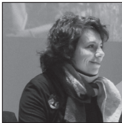
Sandrine Salerno, Maire de la Ville de Genève.

mais bien l'ensemble de la société. La Ville a ainsi apporté son soutien à des actions de sensibilisation tels que le festival du film «Mangeurs d'avenir» ou «Food Focus» et choisi, en 2010, la paysannerie comme invitée d'honneur de la Fête du 1 er août au centre ville. Elle a par ailleurs apporté son soutien à des actions permettant de contribuer à freiner l'exode rural: au sud en soutenant des projets de la Fédération genevoise de coopération et, à Genève, en soutenant des coopératives ayant des projets créateurs d'emplois. On peut citer l'achat d'un moulin à céréales ou l'appui au projet «Les Artichauts»: des anciennes serres du Service des espaces verts ont été récupérées au cœur de la ville afin de développer un système de cueillette et de vente directe favorisant la rencontre entre producteurs et consommateurs en milieu urbain. S'y ajoute la production de semences et plantons bio et la sélection de graines.