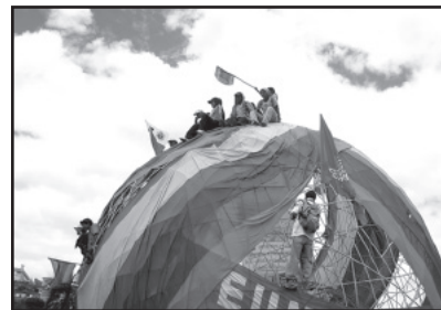
Manifestation en Equateur.

Un autre frein à la réalisation d'une politique basée sur la souveraineté alimentaire est que celle-ci est encore perçue comme un thème rural alors qu'il concerne pourtant l'ensemble de la société. Dans le processus de reconnaissance constitutionnel, les différentes strates de la société sont restées en marge du débat. Il s'agit donc de les intégrer pleinement dans l'aventure, notamment en encourageant les régions à s'impliquer, en démocratisant les processus. Une campagne a été lancée auprès de la population pour faire connaître l'existence de ces lois et l'absolue nécessité de les mettre en œuvre pour le bien du plus grand nombre.