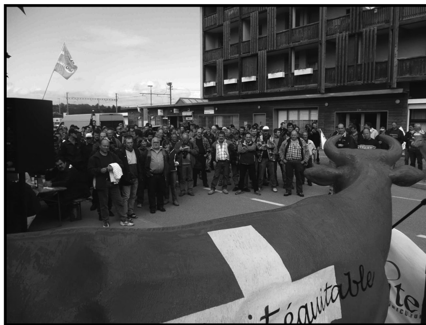
A Pringy, le 16 septembre dernier, plus de 300 producteurs étaient présents.

Au niveau national, les rencontres avec PSL et BIG-M et avec différentes organisations de producteurs se multiplient. La mise en place d'un système de gestion des quantités pour obtenir un prix équitable au niveau national est un outil que l'on doit mettre en place rapidement afin que les producteurs puissent maîtriser leurs marchés. La