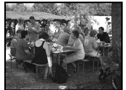
Le temps du brunch est arrivé.

Selon les participant-e-s, la Fédération doit permettre aux agriculteurs et aux consommateurs de se positionner et de défendre un point de vue sur ces sujets cruciaux, en lien avec Uniterre et l'Union Suisse des Paysans. Un point de référence de la FRACP pour son positionnement est le contenu de sa Charte. Il s'agit d'ailleurs, pour beaucoup de participant-e-s, de promouvoir la Charte en interne pour rendre les initiatives ACP toujours plus cohérentes entre elles; par exemple en matière de prix des paniers, de salaires agricoles, etc.