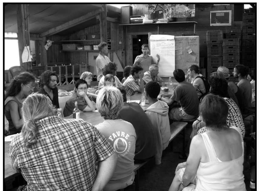
A l'abri des quelques gouttes de pluie, discussion constructive sur l'ACP.

Le dernier point traité est le rôle de la Fédération dans les revendications liées à la politique agricole.