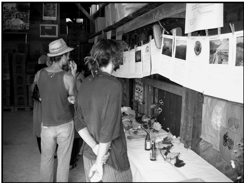
Des posters présentant chaque initiative d'agriculture contractuelle de proximité.