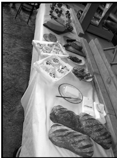
Le buffet des produits.