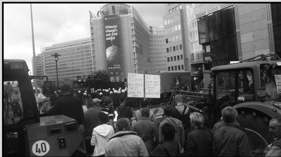
2010 reverra-t-elle des images de mobilisations en Europe comme en Suisse? Ici les images de Bruxelles en automne 2009. Reprenons le slogan sur le bâtiment valable aussi pour le lait: «agir et adapter».

Pour garantir une pression maximale sur les prix indigènes, l'IP-Lait annonce également que les paysans seront priés de contribuer à l'abaissement du prix de la matière première suisse en finançant, à part égale avec les transformateurs industriels (chacun à hauteur de 1ct. par litre de lait dès le 1 er mai), un fond de 20 millions maximum qui compensera le déficit (55 millions de francs) de la loi chocolatière. Cette loi chocolatière permet de réduire artificiellement le prix de la matière première suisse afin d'éviter que les industriels suisses ne s'approvisionnent trop fortement en matières premières