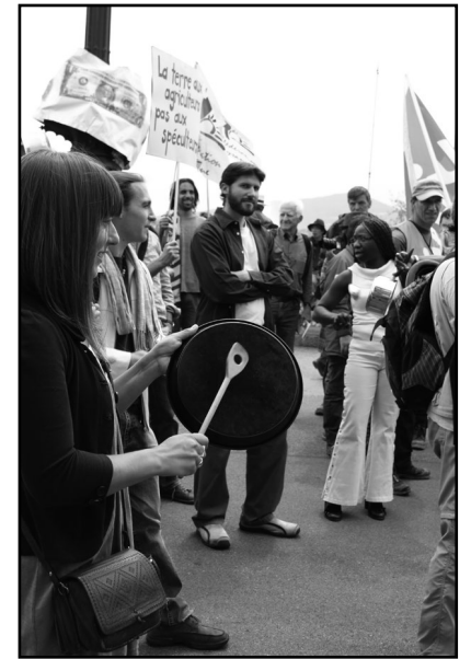
Les manifestants se sont fait entendre par les confédérés.

justice sociale, ...), des ONG (Cetim, Pain pour le Prochain, FIAN, cotmec...) a décidé de se mobiliser pour dénoncer la tenue de cette réunion et l'appui de l'État de Genève à celle-ci. Une conférence de presse et une manifestation ont eu lieu devant le Grand Hôtel Kempinski.