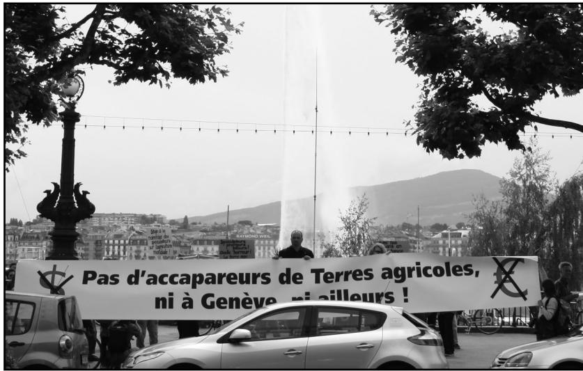
Plusieurs dizaines de manifestants se sont positionnés devant l'entrée de l'hôtel Kempinski qui accueillait la «conférence des accapareurs».

Derrière cette terminologie récente se cache un phénomène mondial engagé depuis quelques années mais qui s'est accéléré depuis la dernière crise financière et l'envolée du prix des denrées alimentaires qui s'ensuit. Elle a attisé la soif des spéculateurs relayés par des fonds de placement gérés le plus souvent par des Banques (UBS, Crédit Suisse, Banque Pictet, Sarasin, Julius Bär...).