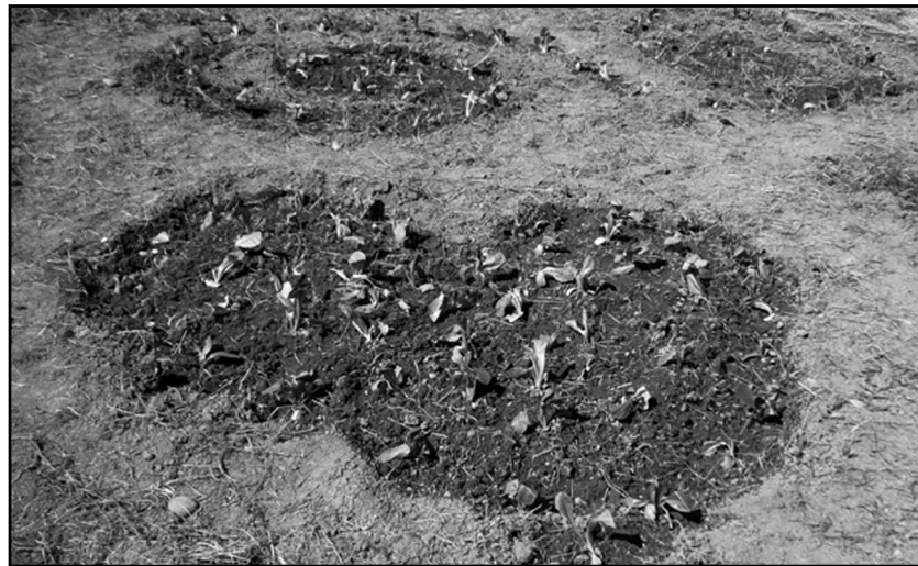
Plantons de salade en cercle et coeur lors de la journée des luttes paysannes le 17 avril 2011: recyclage et échelle humaine ...

ou de faire le travail le plus simple à l'aide d'un cheval? Les agriculteurs et agricultrices biologiques se retrouvent dans le même piège que le reste de la société. Comment allons-nous produire, lorsque le flot de pétrole tarira? Ne devrions-nous pas prendre les devants et préparer l'agriculture postfossile? Comment un tel changement peut-il être amorcé d'un point de vue économique? Tout mouvement allant dans cette direction dépend du soutien de la société entière. Cependant, les paysans peuvent jouer un rôle de pionnier dans ce processus: nous devons tenter de convaincre le plus de personnes possible de soulever ce défi avec nous.