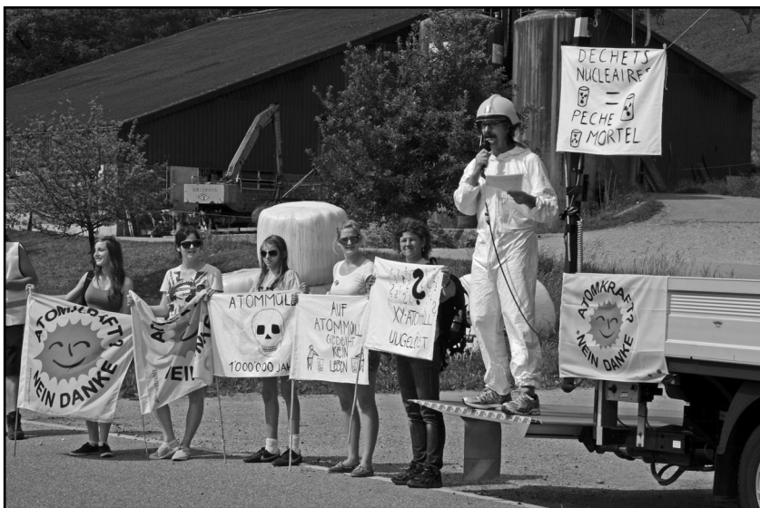
20'000 AKW- GegnerInnen versammelten sich zu einem Protestmarsch im Aargau.

Die von Uniterre mitgetragene Kundgebung war ein eindrückliches Zeichen für erneuerbare Energien.