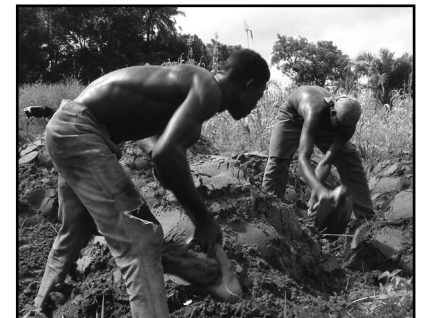
Pour une agriculture intensive en main-d'oeuvre.

Avec l'huile rouge locale, le riz étuvé, la farine de sorgho qui remplace une