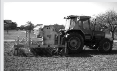
Cultivateur à pattes d'oies Ecodyn permettant un travail du sol très superficiel photo: M. Clerc)

- la technique agricole bio intéresse beaucoup les producteurs bio. Les visites de cultures sont d'ailleurs nettement plus prisées par les paysans bio que conventionnels.