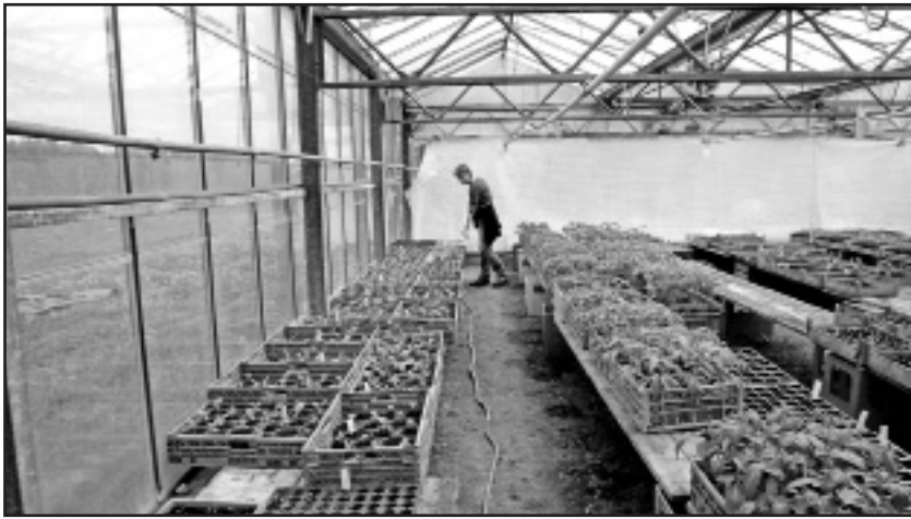
Zubereitung von Gmües-Abos