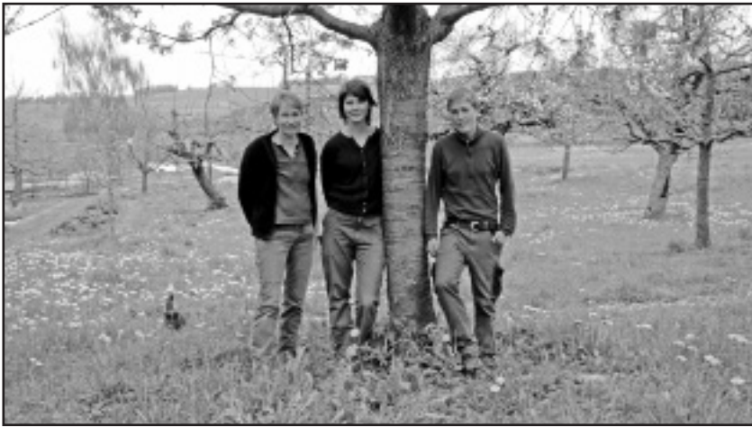
Das Team «Holzlabor»

In Thalheim habe ich das Holzlabor besucht, welches zwei Projekte beherbergt. Auf der einen Seite die Werkstatt für Wagenbau mit Schreinerei und auf der anderen Seite der landwirtschaftliche Betrieb mit dem Gmües-Abo.