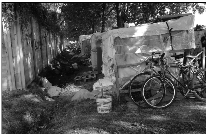
Campeement des migrants à Saluzzo (Italie) contre l'enceinte de la foire agricole annuelle