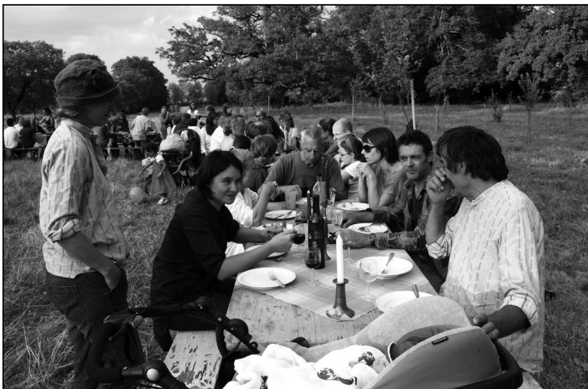
Souper en plein champ aux Cueillettes de Landecy, été 2013.

Voir aussi cet article publié en 2007 : http://www.uniterre.ch/data/docs/agricontra/cueilletteLandecy.pdf