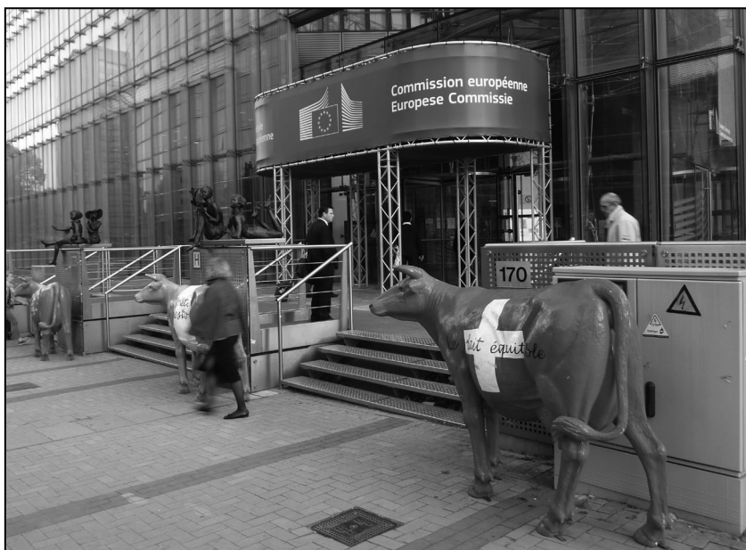
Est-ce que le destin d'une filière laitière équitable en Suisse se jouerait à Bruxelles? Probable...