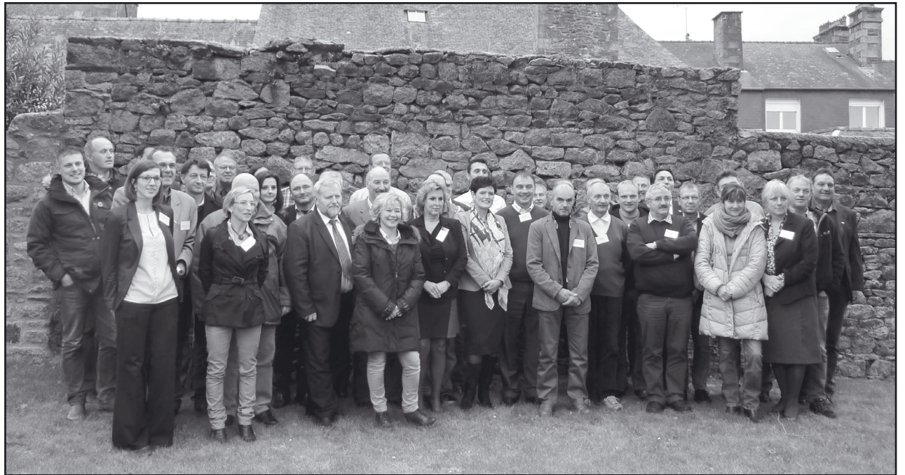
Photo de famille de la fédération.

Pour les milieux de l'industrie, la production ne va pas reculer ou très peu. De 2013 à 2014 elle a même augmenté de 5,4%. Les producteurs de lait ne travaillent que dans un esprit individuel et ne peuvent pas assumer la responsabilité du marché. Ils vont essayer, en augmentant la production, de maintenir au mieux leur flux de trésorerie. Selon les estimations d'Eurocommerce (commerce de détail), la consommation de lait ne va pas augmenter dans l'UE et de trop gros excédents poseraient beaucoup de problèmes étant donné la faible valorisation du beurre et de la poudre. Pour Eucolait (négociants, industriels), le marché est sur-approvisionné en dépit d'une bonne demande mondiale. Les producteurs doivent réagir.